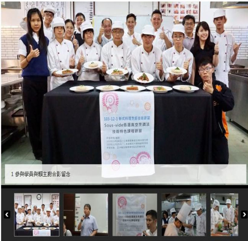
1 參與學員與賴主廚合影留念